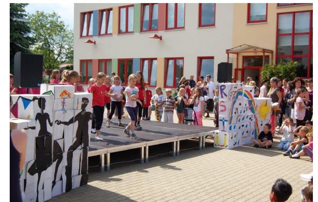
Unsere erworbene Bühne für die Auftritte bei Schulevents

Mit Aufdrucken und Planen werben wir für unsere Grundschule