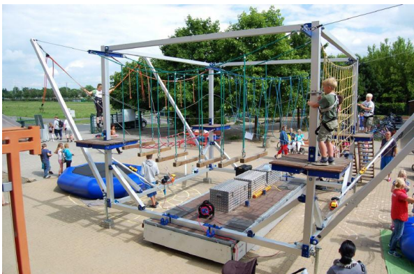
Gestellter Kletterparcour für das Schulfest