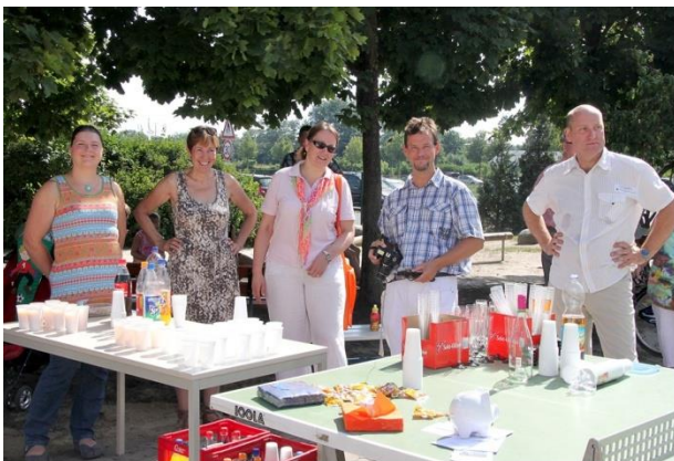
Erfrischungsteam © bei der Einschulung